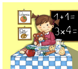
RISTORAZIONE SCOLASTICA E COLLETTIVA