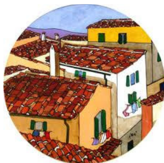
ALLOGGI AD USO SOCIALE